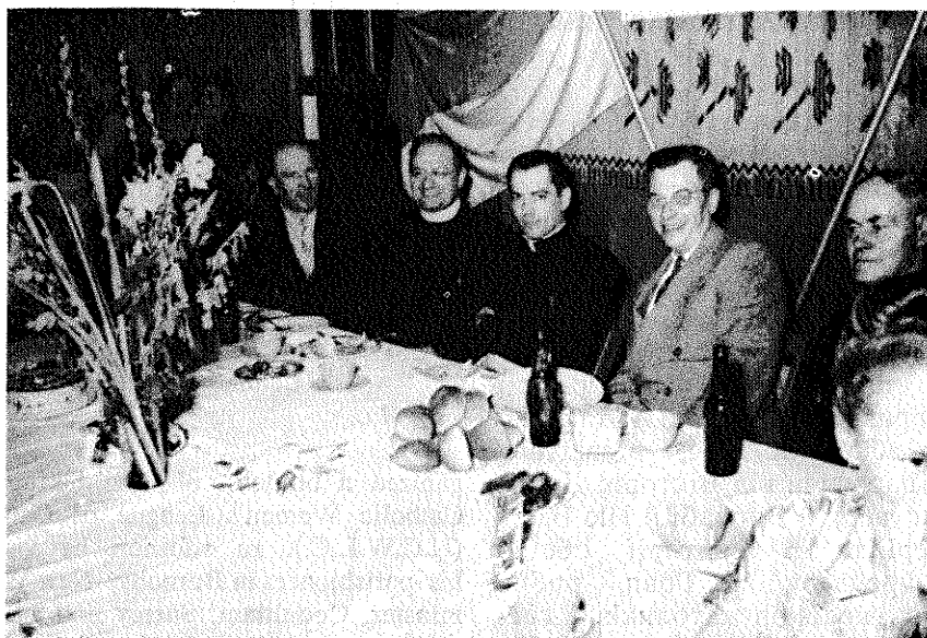
Головний стіл під час спільного свяченого, 1952.