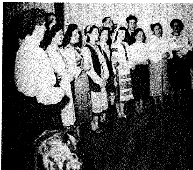
Український Національ- ний Мішаний Хор, 1953